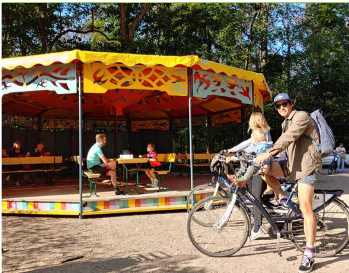
Met een carrousel tent creëren we extra terrasruimte op het parkeerterrein.

Vrij snel na de lockdown stonden vrienden op de stoep om te helpen de eerste financiële klappen op te vangen. De overheid zorgde, zoals bij zo vele bedrijven, voor het leeuwendeel van de salarissen. Vrienden steunden met giften en aanschaf van tegoedbonnen. De meeste van de nu onbruikbare tickets werden door het publiek geschonken aan de artiesten en het Beauforthuis. Steun van de gemeente Zeist gloorde aan de horizon.